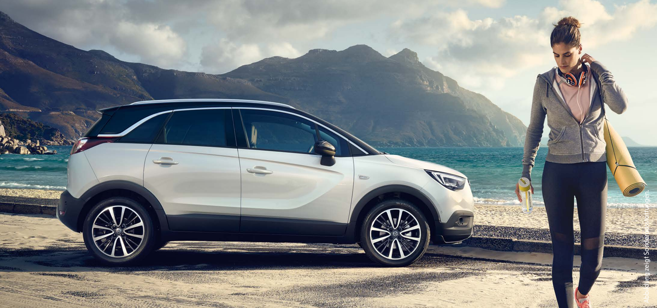
Abbildung zeigt Sonderausstattungen.