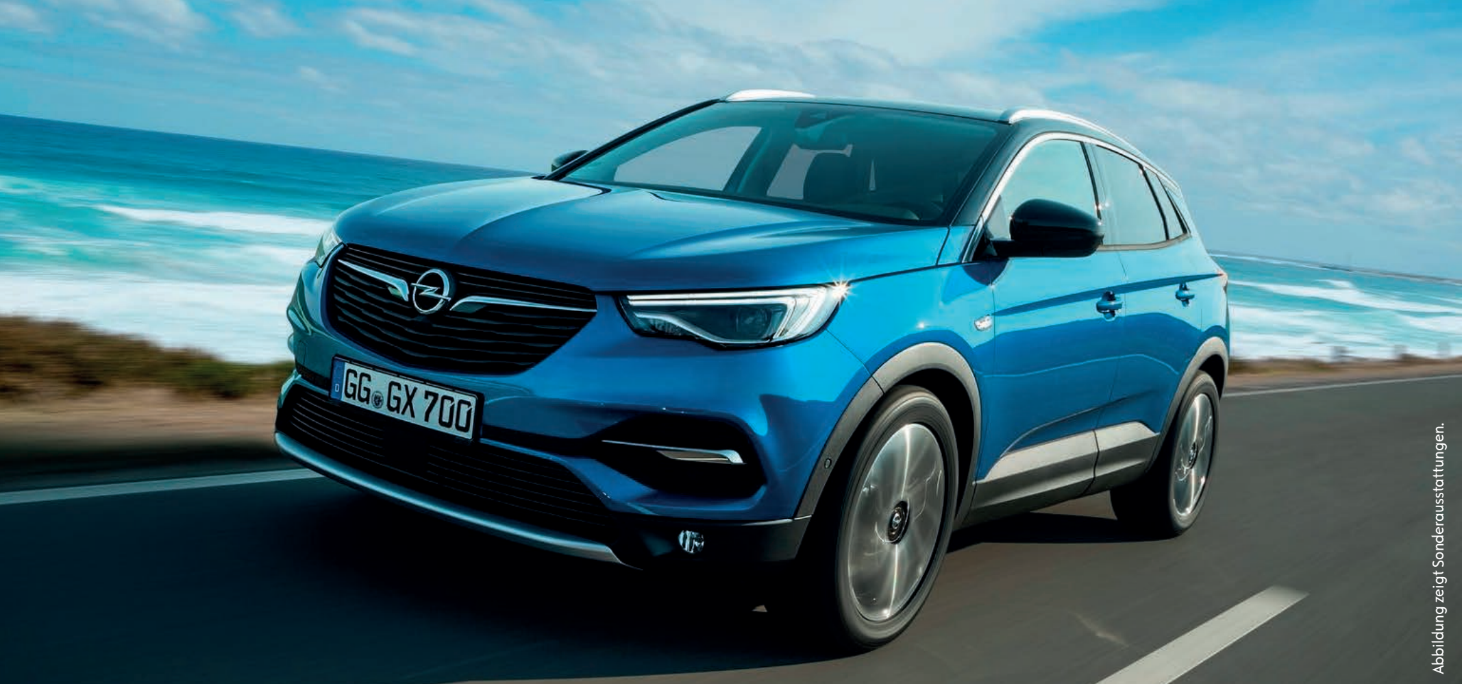
Abbildung zeigt Sonderausstattungen.