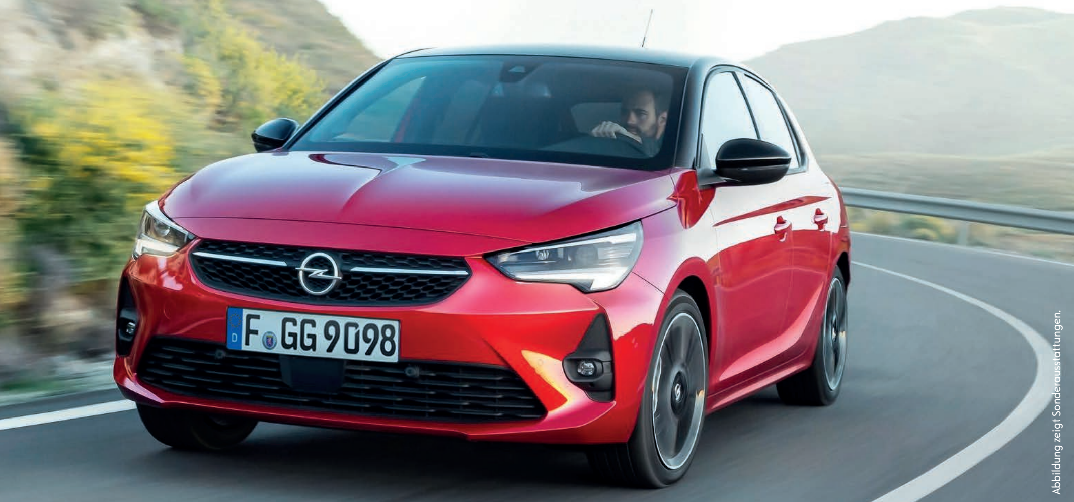
Abbildung zeigt Sonderausstattungen.